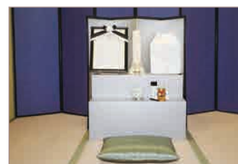
▶ 後飾り（ダンボール製） 【16,500円】