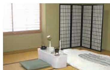
▶ 霊安室1日（最長2日まで） （面会時間：9時30分～17時30分）