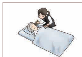
▶ 立ち会い納棺（ラストメイク） 【49,500円】