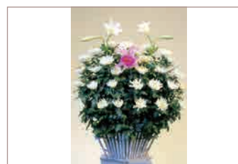
▶ 供花 【1基：16,500円】