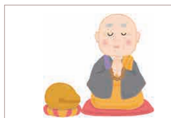
▶ お坊さんをお呼びたい場合 お付き合いのあるお坊さんがいない場合は当社でご手配可能です 【お布施：65,000円】